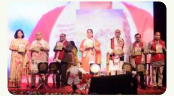
विमोचन - स्मरणिका "प्राची"