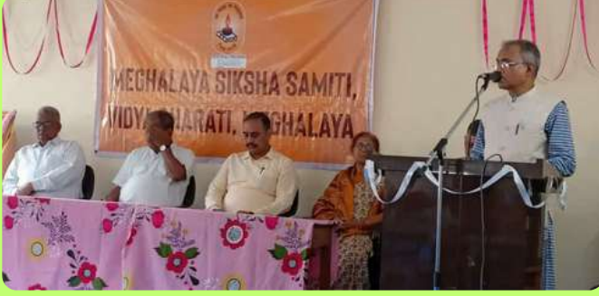
शिलांग, पूर्व खासी पहाड़