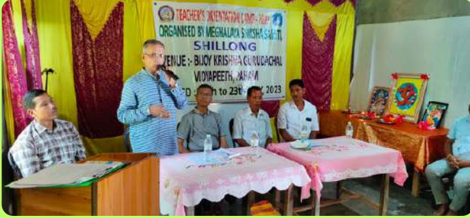
पहाम, पश्चिम गारो पहाड़