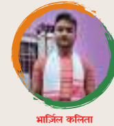
भाजिन कलिता शंकरदेव शिशु निकेतन बरमा