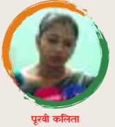
पूरवी कलिता शंकरदेव शिशु निकेतन विष्णुपथ