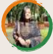
विदिशा बोंरा शंकरदेव शिशु निकेतन हंगरावारी