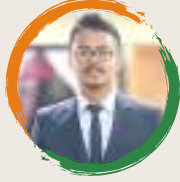
विनयन चमूवा शंकरदेव शिशु निकेतन ढकुआखना