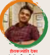
हीराकज्योति देका शंकरदेव शिशु निकेतन विष्णुपथ