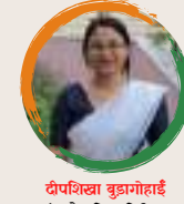
दीपशिक्षा बुढागोहाई शंकरदेव शिशु निकेतन बिहपुरिया