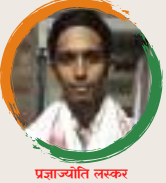
प्रजाज्योति लस्कर शंकरदेव शिशु निकेतन कामपुर