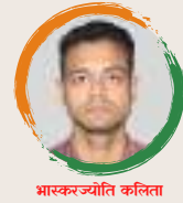
भास्करज्योति कलिता शंकरदेव शिशु निकेतन छयगांव