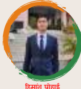
हिमांशु घोहाई शंकरदेव शिशु निकेतन धेमाजी